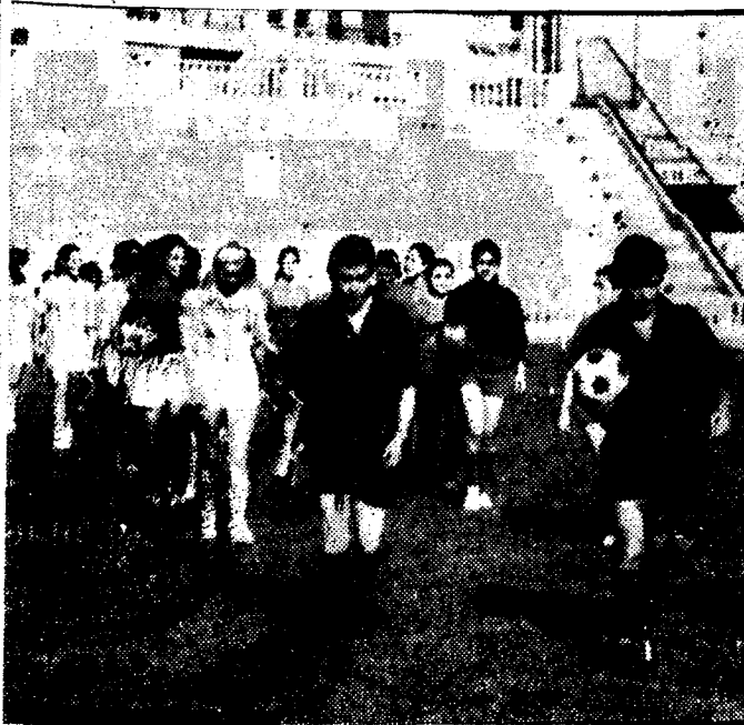
Esta es la salida de los equipos al terreno de juego, con el conjunto arbitral al frente.

Tres goles decidieron el encuentro de fútbol femenino en Huelva